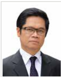
TS. VŨ TIẾN LỘC Chủ tịch Trung tâm Trọng tài Quốc tế Việt Nam President of Vietnam International Arbitration Center

Tiến sĩ Vũ Tiến Lộc là một Chính trị gia, Nhà kinh tế có ảnh hưởng lớn tới cộng đồng doanh nghiệp và khởi nghiệp ở Việt Nam và trên thế giới.